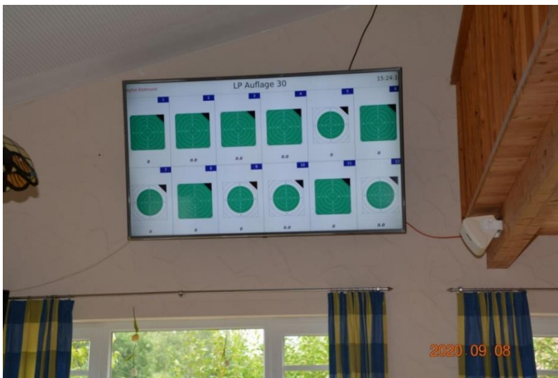
(und so sieht der Stand nach den Umbauarbeiten aus)