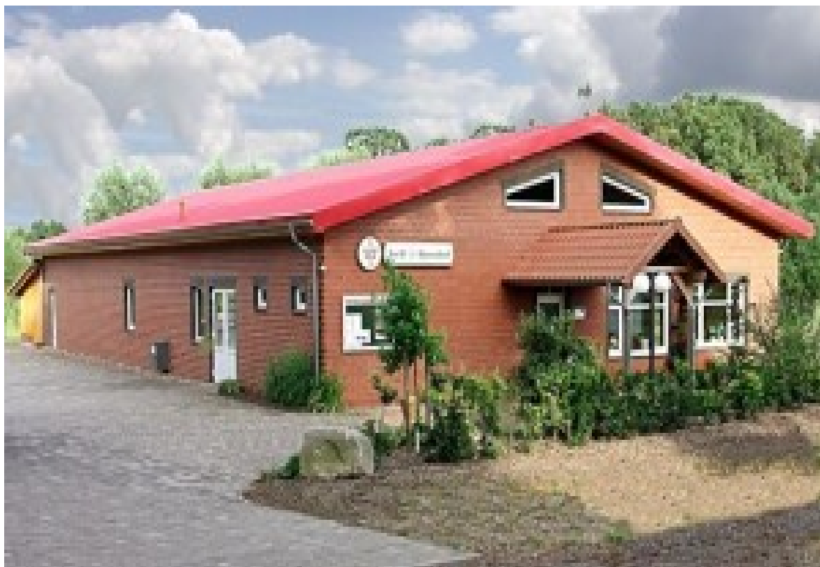
Dorfgemeinschaftshaus „Treffpunkt des SV Haendorf